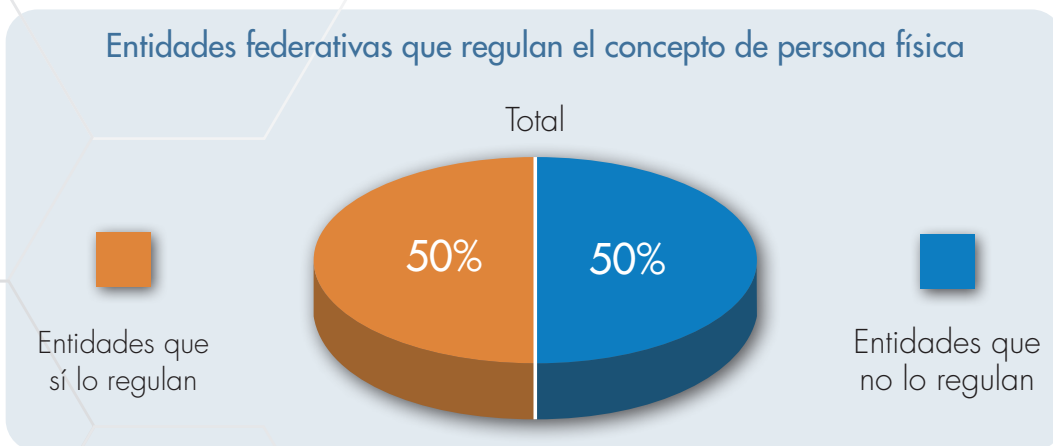
Figura 4. Porcentaje de entidades federativas que regulan el concepto de persona física